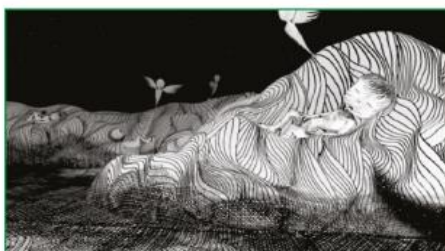
Fonte: Morte e Vida Severina, João Cabral de Melo. Desenho Animado do Cartunista Miguel Falção.

As produções textuais em linguagem escrita também foram inspiradas em imagens veiculadas em obras literárias brasileiras lidas e analisadas durante as aulas de português, e/ou criadas a partir de fotografias de domínio público. São exemplos: